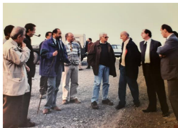
Sopralluogo durante la frana del 1994